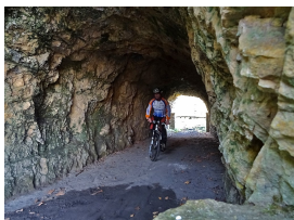
Túnel en la senda de Priañes

El 21 de Agosto, las fuerzas republicanas aplastan la resistencia de los cercados en el cuartel de Simancas en Gijón, lo que convierte la liberación de los sublevados cercados en Oviedo en el único objetivo para las ya conocidas como "Columnas Gallegas", que llegan a la desembocadura del Nalón el 7 de septiembre.