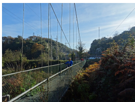
Puente colgante sobre el río Nalón

El 15 entran en Grado para marchar hacia Oviedo por Trubia, pero son frenados por las fuerzas gubernamentales, que obstaculizan sus avances. Al tiempo, desde Galicia se les comunica que no hay reservas por lo que no será posible reforzarlas. Es entonces cuando el general Franco decide enviar las tropas del Ejército de África que en esos momentos cruzaban el Estrecho: el tercer tabor de Ceuta y la 3ª Bandera de la Legión, primeramente, y los cuartos tabores de Tetuán, Alhucemas, Cauta, Melilla, y Larache, después.