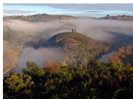
Picos de Europa del Nora, desde el mirador de Priañaes

Mahatma Gandhi (1869-1948). Político y pensador indio.