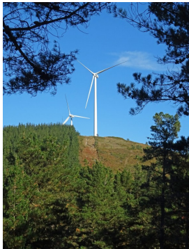
Parque eólico en La Sierra de La Degollada

Publicado por Cicloturismo - 27 Ago 2017 00:00