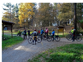
Área recreativa de La Degollada