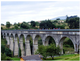
Ciclando el acueducto de Ensidesa