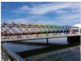
Puente de Colores del Niemeyer (Avilés)