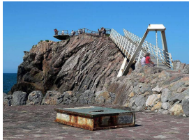
Esculturas del Museo de Las Anclas (Salinas-Arno)

Llegaremos a la Playa de Arno , donde podremos visitar el Museo de la Minería , en lo que antaño fue una mina de carbón cuyas galerías submarinas recorrió allá por 1858, la reina Isabel II, que se alojaba en el palacio del