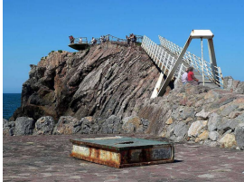
Esculturas del Museo de Las Anclas (Salinas-Arnao)

Llegaremos a la Playa de Arnao , donde podremos visitar el Museo de la Minería , en lo que antaño fue una mina de carbón cuyas galerías submarinas recorrió allá por 1858, la reina Isabel II, que se alojaba en el palacio del