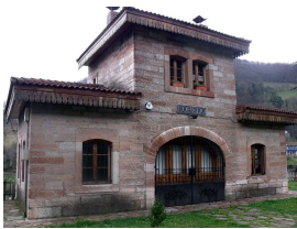
Aula de interpretación del ferrocarril en Lloredo

6. En el Km 46,03, alto de Las Segadas . A continuación tomamos a la derecha hacia La Manjoya , y por la senda de Fuso llegamos al Parque de Invierno (Oviedo, km 51), fin de ruta.