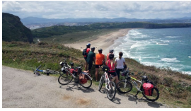
Cicloturistas desde el mirador de Xagón

Publicado por Cicloturismo - 05 Ago 2017 00:00