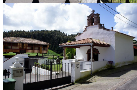
En la Torre del Regueral

Decíamos que transitaremos por el interior, concretamente por el valle de Zanzabornín , en el que podríamos considerar a la