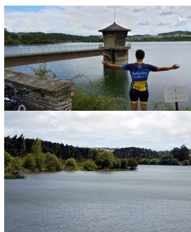
Embalse de La Granda