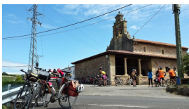
Iglesia de San Jorge de Manzaneda

Dicha frase hace alusión a la mala época que supuso dicho año, pues recordemos que en esas fechas Asturias está en plena guerra de la Independencia a lo que hay que sumar acontecimientos como que el regimiento Asturias combatía con dureza en León. Y aunque seguramente los constructores de la torre no se referían a ello, el 27 de noviembre también muere el ilustrísimo Jovellanos.