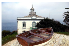
Faro de Candás