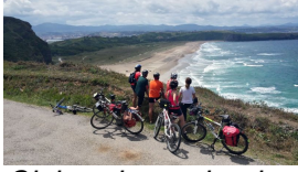
Cicloturistas desde el mirador de Xagón

Publicado por Cicloturismo - 05 Ago 2017 00:00