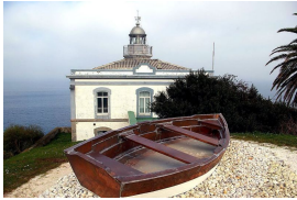
Faro de Candás