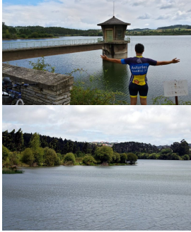
Embalse de La Granda