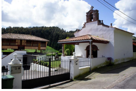
En la Torre del Regueral

Decíamos que transitaremos por el interior, concretamente por el valle de Zanzabornín , en el que podríamos considerar a la