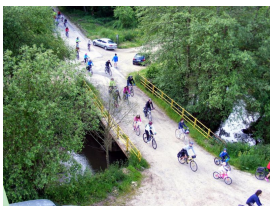
Senda fluvial del Nora en Los Corros

y los restos de lo que parece una vieja chimenea industrial.