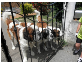
San Bernardos en La Carrera (Siero)