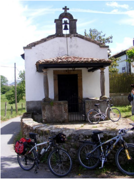
María Faes, La Carrera (Siero)

En Pola de Siero , tras una breve pero dura subida, enlazaremos con una pista que nos conducirá hasta El Berrón. En el camino nos encontraremos con el caserón y la capilla de María Faes así como con unos enormes perros San Bernardo custodiando una finca debidamente vallada.