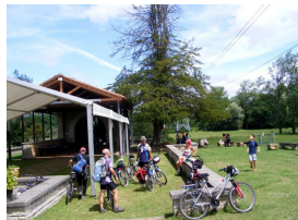
Santuario Virgen de la Cabeza, Meres