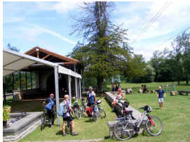
Santuario Virgen de la Cabeza, Meres