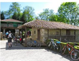
Molín de la Enceña

De El Berrón a Meres ya no hay pista, sino que se pedalea por carreteras secundarias. En los 4 kilómetros sin apenas tráfico —pero al fin y al cabo, carretera— donde deberemos extremar precauciones, nos sorprenderá lo colorido de algunos chalets.