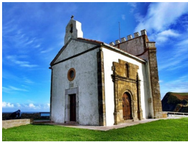
Ermita de Ntra. Señora de La Guía. Ribadesella

— La cueva es el lugar por donde el pueblo puede salvar la barrera de montañas, y salir de su hermoso valle al resto del mundo.