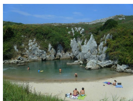
Playa de Gulpiyuri, Llanes