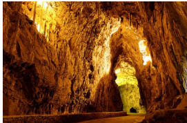
La Cuevona de Cueves, Ribadesella

** Recorrido apto para menores (RM) con más de 10-11 años y soltura en la bici.