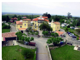
Garaña o Casona de Los Argüelles

En el Parque de Garaña cogemos el PR.AS-57 o Senda de Los Bufones de Pría —perteneciente a la Senda Costera GR.E-9—, senda preciosa donde las haya, que une las playas de Guadalmía, Villanueva, Cuevas del Mar, San Antonio del Mar, Gulpiyuri y San Antolín de Bedón. Aquí comienza, sin duda, la parte más hermosa de la ruta. El único inconveniente es que en este tramo sí que hay continuas subidas y bajadas, coincidiendo con cada una de las playas.