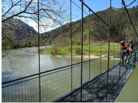
nte colgante sobre el río Sella

Tras la comida, y la visita obligada a la Cuevona donde disfrutaremos de sus 300m serpenteantes y apreciaremos sus magníficas formaciones calcáreas como estalactitas, estalagmitas o coladas de gran belleza, nos reagruparemos en Cuevas, a la hora previamente indicada, donde proseguiremos la marcha. A partir de aquí hasta Arriendas ya todo el perfil es fácilmente pedaleable.