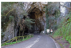
Entrada a la Cueva