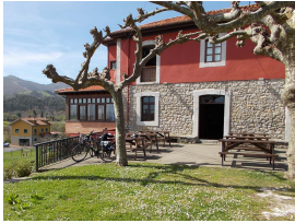
Bar donde pararemos en El Carmen