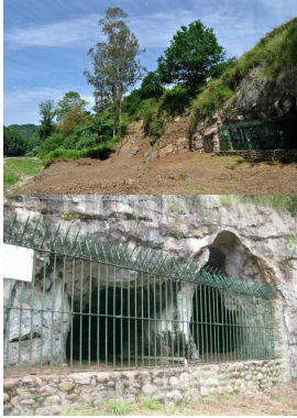
Cueva de La Lluera

Publicado por Cicloturismo - 04 Jun 2017 00:58