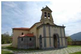
Iglesia de San Juan de Priorio

Después de la visita, nos acercaremos a la iglesia de San Juan de Priorio . La iglesia de San Juan de Priorio, del s. XII - XIII, es una de las más importantes construcciones del románico asturiano.