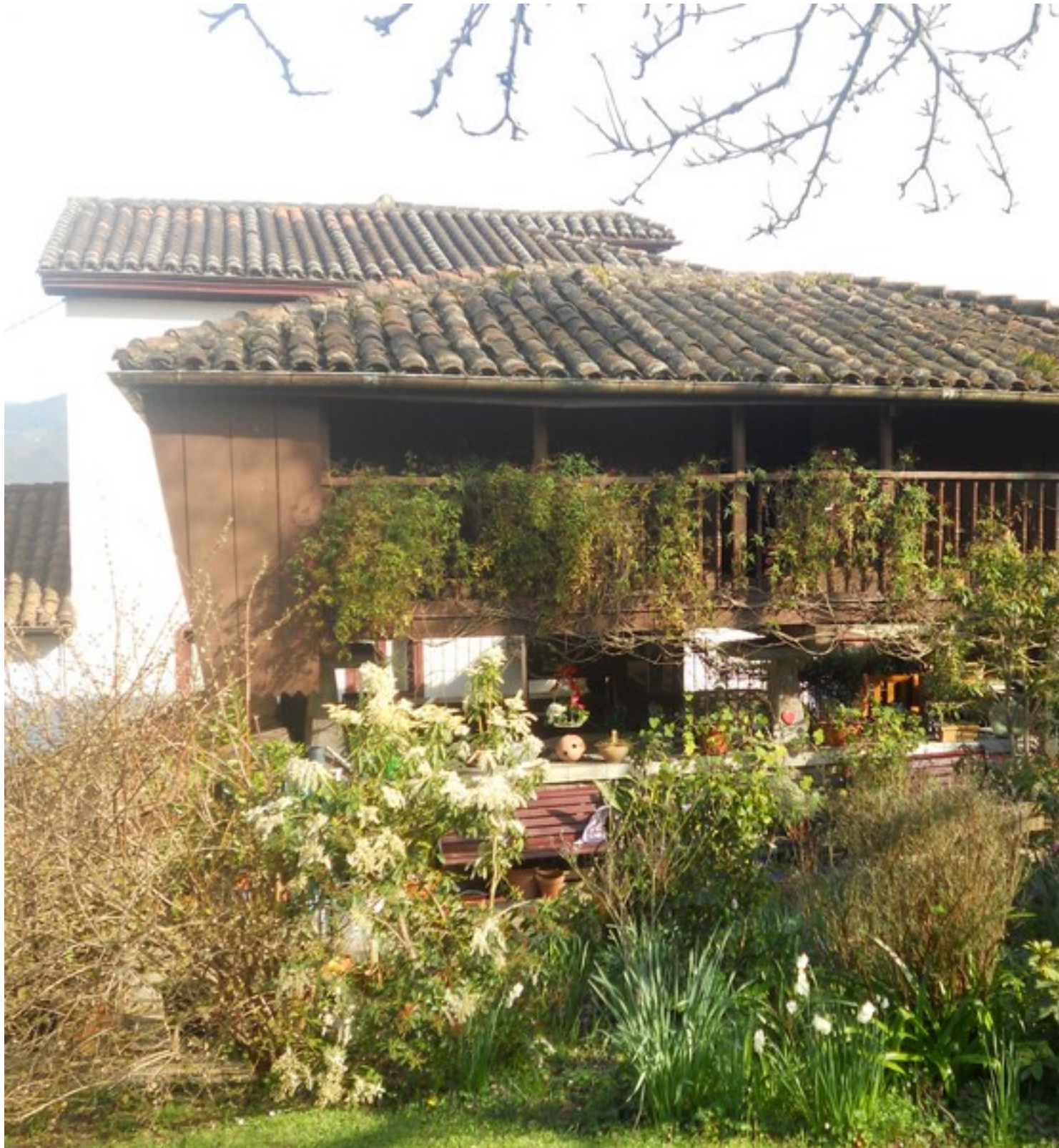
El jardín de los aromas. Hoy ya cerrado

Publicado por Cicloturismo - 13 May 2017 16:35