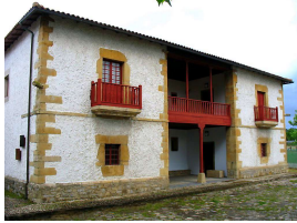
Casona de los González-Vega

imagen muy repetida en el románico y conocida como cabeza engolada que tuvieron gran importancia a finales del siglo XII y principios del XIII.