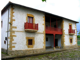
Casona de los González-Vega

imagen muy repetida en el románico y conocida como cabeza engolada que tuvieron gran importancia a finales del siglo XII y principios del XIII.