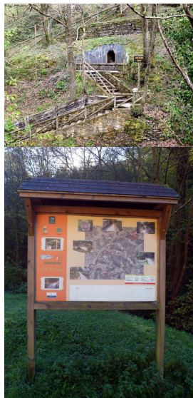
El mechero de Saús, en plena senda del Trole

Publicado por Cicloturismo - 02 Abr 2017 16:27