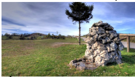
Área recreativa de La Camperona

Saldremos de El Entrego para en el PK. 2 tomar la senda verde de Carrocera , sitio precioso entre árboles y con frescor. Lamentablemente no es muy larga y, casi al final de la misma, nos tenemos que salir a la comarcal AS-338 para subir al pueblín de