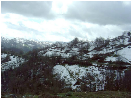
Subida a La Camperona nevada

La ruta pasa por los concejos de Langreo y Mieres, zonas de gran actividad carbonífera en otros tiempos . En la actualidad disfrutaremos de los paisajes heredados y podremos comprobar como la vegetación disimula lo que antes fueron bocaminas, escombreras e infraestructuras mineras —resulta asombroso el poder restaurador de la naturaleza—. No obstante aún quedan restos de castille y se conservan algunas edificaciones de antiguas minas (oficinas, escuelas, casa de Los Felgueroso , etcétera), destacando entre todas estas construcciones la central eléctrica con su gran chimenea de ladrillo.