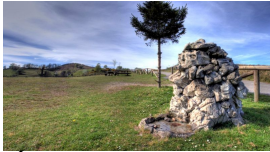
Área recreativa de La Camperona

Saldremos de El Entrego para en el PK. 2 tomar la senda verde de Carrocera , sitio precioso entre árboles y con frescor. Lamentablemente no es muy larga y, casi al final de la misma, nos tenemos que salir a la comarcal AS-338 para subir al pueblín de