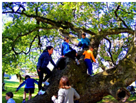
Juventud trepando por los hayedos del Tragamón

(Navelgas, Tineo, 1943), fue un encargo del Ministerio de Fomento para su instalación en la rotonda de La Guía. La forman dos piezas, distanciadas unos metros: una familia —papá, mamá y el niño con su bicicleta— apoyada en la barandilla, de espaldas a la ciudad; y unos metros detrás, el tronco de un árbol hueco.