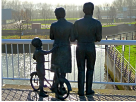
Sentimientos, escultura del pintor tinetense Manuel García Linares

** ¡¡Recomendada para ciclistas noveles!!