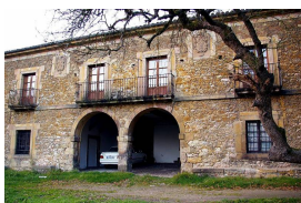
Casa-Palacio de El Rebollín

La Torre del Reloj está situada en la cima de El Rebollín. Monumento más emblemático de la villa debido a su singular visibilidad, data de 1694 y fue, posiblemente, un lugar de reunión municipal y, posteriormente, cárcel. En su interior se puede apreciar el perfecto estado de los mecanismos construidos, en 1864, por José Martínez, relojero del Ayuntamiento de Bilbao. Ha servido para controlar las horas de trabajo en los talleres de zapateros y demás actividades de la villa, mediante el sonido de