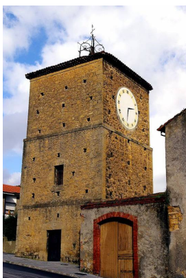
Torre del reloj de Noreña

Entraremos en Noreña, por la zona de la Torre del reloj , pasando por delante de la Casa-Palacio del Rebollín . Si disfrutan de la ruta en sábado, nuestro caso, habrá mercado donde se puede comprar algo para comer en el parque, una amplia zona verde donde poder comer un bocadillo, o quien desee comer en un bar, en Noreña no le faltan sitios.