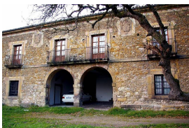
Casa-Palacio de El Rebollín

La Torre del Reloj está situada en la cima de El Rebollín. Monumento más emblemático de la villa debido a su singular visibilidad, data de 1694 y fue, posiblemente, un lugar de reunión municipal y, posteriormente, cárcel. En su interior se puede apreciar el perfecto estado de los mecanismos construidos, en 1864, por José Martínez, relojero del Ayuntamiento de Bilbao. Ha servido para controlar las horas de trabajo en los talleres de zapateros y demás actividades de la villa, mediante el sonido de