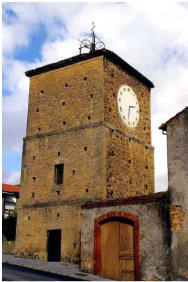
Torre del reloj de Noreña

Entraremos en Noreña, por la zona de la Torre del reloj , pasando por delante de la Casa-Palacio del Rebollín . Si disfrutan de la ruta en sábado, nuestro caso, habrá mercado donde se puede comprar algo para comer en el parque, una amplia zona verde donde poder comer un bocadillo, o quien desee comer en un bar, en Noreña no le faltan sitios.