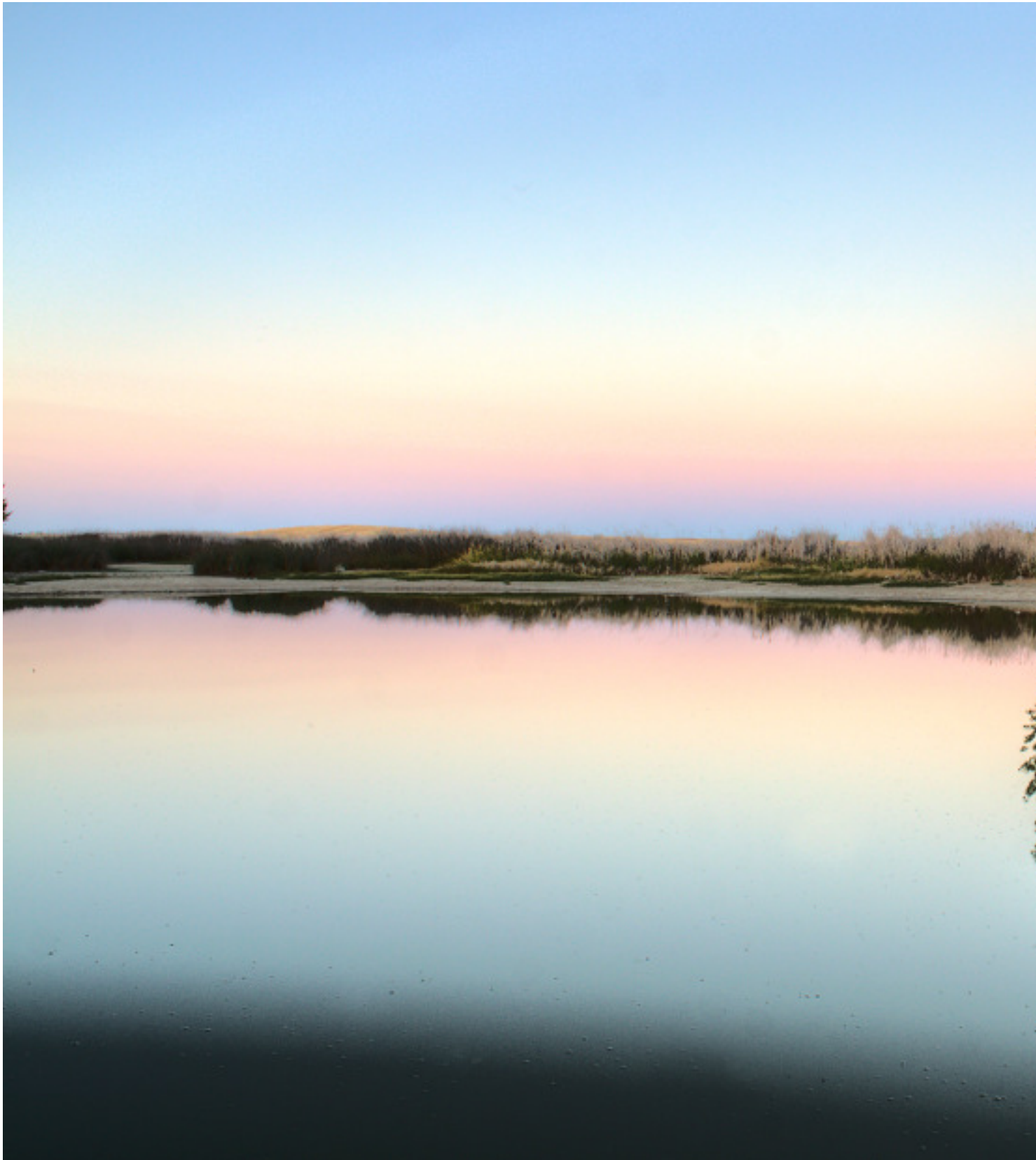
Atardecer en la laguna de Villafáfila

Publicado por Cicloturismo - 20 Mar 2017 14:44