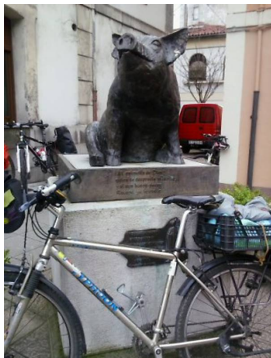
El Gochín de Noreña

** ¡¡Recomendada para ciclistas noveles!!