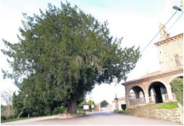
e San Juan Bautista en Cenero