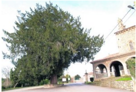
e San Juan Bautista en Cenero