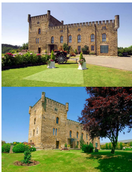
Torre de Valdés, San Cucao

, pero antes visitaremos los alrededores de su castillo, la Torre de Valdés.