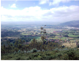
Dominios de Llanera desde el Picu Santu Firme

Publicado por Cicloturismo - 05 Mar 2017 16:59