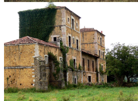
Palacio de Villanueva / San Cucao

La Torre de Valdés , en Llanera, (En la actualidad, El Castillo de San Cucao) es un conjunto monumental y sobrio, formado por una torre y un cuerpo rectangular adosado a la misma que la prolonga hacia el norte. Tiene su origen en una torre cuadrada medieval, mandada construir en el siglo XIV (hacia el año 1393) por Diego Menéndez de Valdés, el Mayor (miembro de esta poderosa e influyente familia); hoy se conserva solamente su estructura general y, al parecer, una pequeña ventana geminada del último piso en la que se talla un escudo, que según F. Sarandeses, presenta las armas de Valdés, Castilla y León y Bernaldo de Quirós, así como la tronera con forma de bocallave situada bajo ella. La torre y el cuerpo rectangular se reformaron en numerosas ocasiones (la última en 1989), dando lugar a la construcción actual, cuya mayor parte parece corresponder a los siglos XIX y XX. Así, la torre, que tiene plantas, reemplazó principios del s. XX su cubierta de teja a cuatro vertientes por un remate