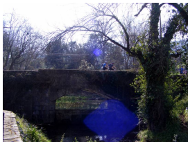
En el Lavaderu de Deva