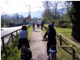
legando a Deva por la senda de Peñafrancia