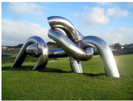
Escultura de La Providencia, Pepe Noja (1999), Gijón