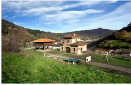
Aula de interpretación del ferrocarril en Lloredo

Publicado por Cicloturismo - 22 Oct 2016 19:00