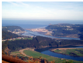
Desembocadura del Nalón (vista del Mirador de Monteagudo)

Publicado por Cicloturismo - 01 Oct 2016 17:53