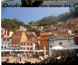
Pedaleando por la Concha de Artedo