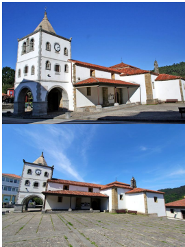
Iglesia de Santa María en Soto de Luiña

La Quinta de Los Selgas —considerada como el monumento civil más importante y uno de los mejores conservados de Asturias gracias a conservar casi intacta su decoración original— es un conjunto de palacio y finca ajardinada que se remonta al finales del siglo XIX. Al palacio y pabellón de tapices —de estilo renacentista italiano— le precede un amplio pasillo de jardines cuyo paradigma es Versalles —en el año 2006 recibieron el premio al mejor jardín Español de mano de la Sociedad de Amigos del Real Jardín Botánico—, donde se exponen obras que ocasionalmente cede el Museo de El Prado. En él podremos contemplar máximas tales como Aníbal vencedor