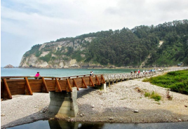
Pedaleando por la Concha de Artedo