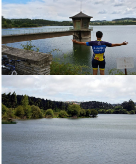
Embalse de La Granda