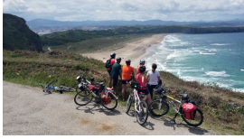
Cicloturistas desde el mirador de Xagón

Publicado por Cicloturismo - 14 Ago 2016 00:00