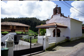
En la Torre del Regueral

Decíamos que transitaremos por el interior, concretamente por el valle de Zanzabornín , en el que podríamos considerar a la