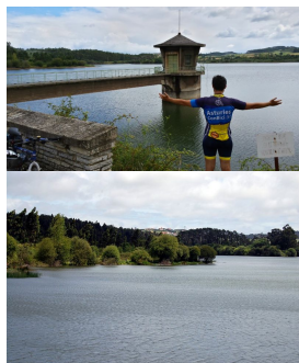
Embalse de La Granda