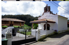
En la Torre del Regueral

Decíamos que transitaremos por el interior, concretamente por el valle de Zanzabornín , en el que podríamos considerar a la