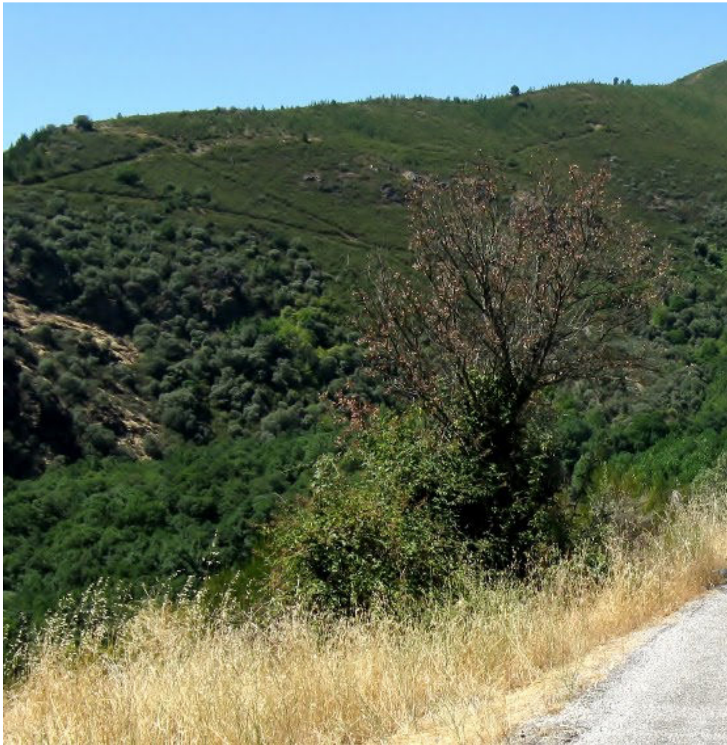
Por El Bierzo y Los Ancares

Publicado por Cicloturismo - 07 Ago 2016 09:19