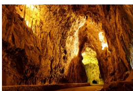
La Cuevona de Cueves, Ribadesella

** Recorrido apto para menores (RM) con más de 10-11 años y soltura en la bici.