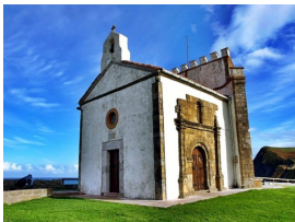
Ermita de Ntra. Señora de La Guía. Ribadesella

—. La cueva es el lugar por donde el pueblo puede salvar la barrera de montañas, y salir de su hermoso valle al resto del mundo.