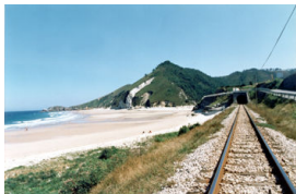
San Antolín de Bedón, Llanes

1. Descansar en la zona de Cuevas del Mar y acercarse a la paradisíaca playa de San Antonio del Mar , muy pequeña y