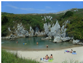
Playa de Gulpiyuri, Llanes