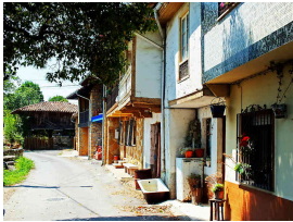
llegando por El Remedio

en el que, si tenemos suerte, podremos ver a algún piragüista entrenando. Aquí habrá que extremar la precaución para compartir este tramo que nos llevará hasta Lieres ya que los habitantes polesos se han quejado innumerables veces de la peligrosidad de algunas bicicletas. Así que respetaremos la señalización horizontal cediéndoles el paso en los puentes para no generar más polémica. Todo este tramo estará regado con verdes praderías, caballos y mucho aire que respirar (aunque la autovía pase cerca).