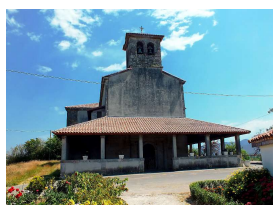
de Nuestra Señora de El Remedio