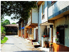
llegando por El Remedio

en el que, si tenemos suerte, podremos ver a algún piragüista entrenando. Aquí habrá que extremar la precaución para compartir este tramo que nos llevará hasta Lieres ya que los habitantes polesos se han quejado innumerables veces de la peligrosidad de algunas bicicletas. Así que respetaremos la señalización horizontal cediéndoles el paso en los puentes para no generar más polémica. Todo este tramo estará regado con verdes praderías, caballos y mucho aire que respirar (aunque la autovía pase cerca).