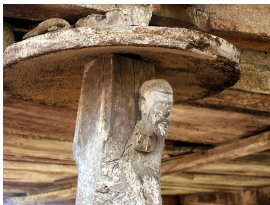
s capiteles de algún que otro hórreo

Hemos intentado diseñar una ruta que pueda adaptarse a todos los públicos, que haya opciones para todos y que por supuesto pasemos un día estupendo disfrutando de nuestra querida amiga la bicicleta ¡Os esperamos!