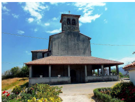
de Nuestra Señora de El Remedio