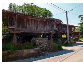
Remedio junto a la bolera y el sendero