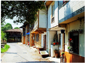
llegando por El Remedio

en el que, si tenemos suerte, podremos ver a algún piragüista entrenando. Aquí habrá que extremar la precaución para compartir este tramo que nos llevará hasta Lieres ya que los habitantes polesos se han quejado innumerables veces de la peligrosidad de algunas bicicletas. Así que respetaremos la señalización horizontal cediéndoles el paso en los puentes para no generar más polémica. Todo este tramo estará regado con verdes praderías, caballos y mucho aire que respirar (aunque la autovía pase cerca).