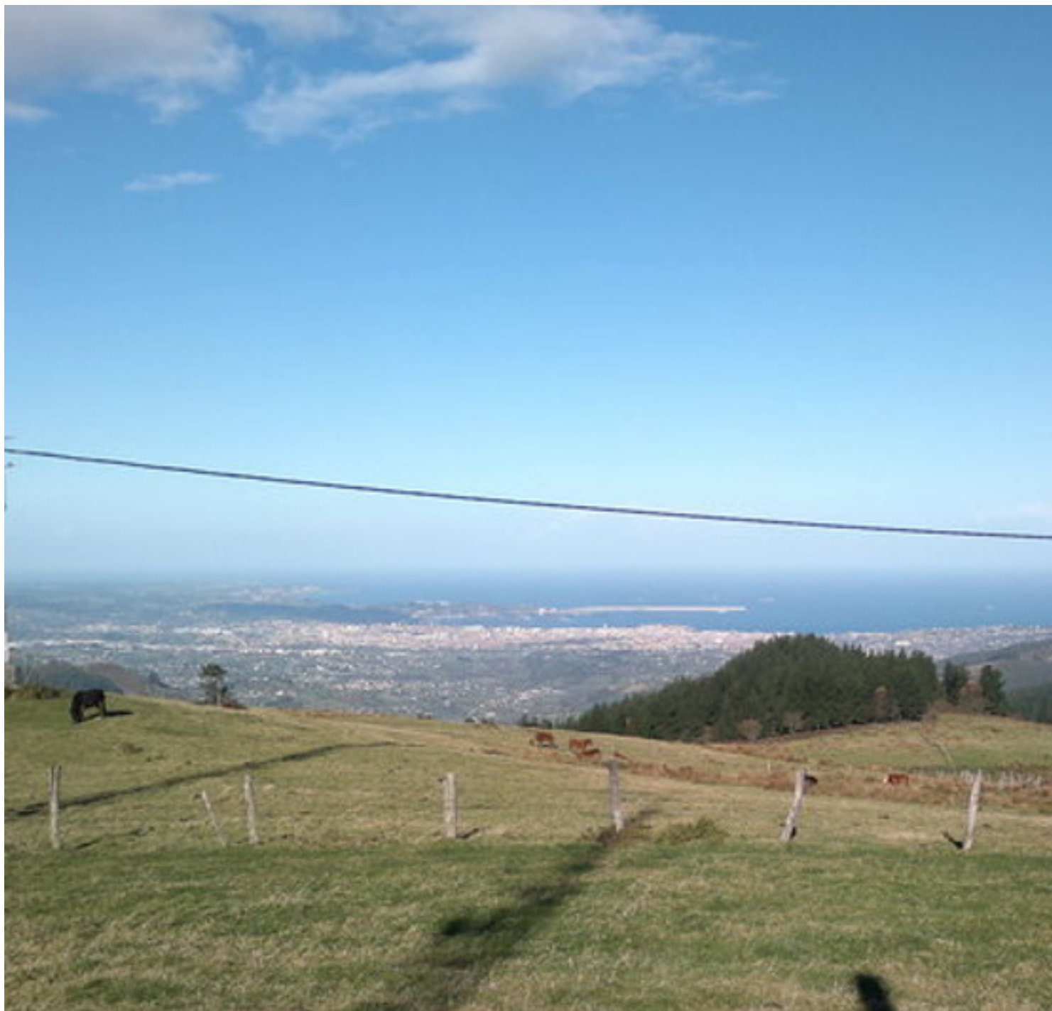
Gijón al fondo