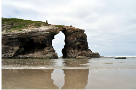
Playa de Las Catedrales