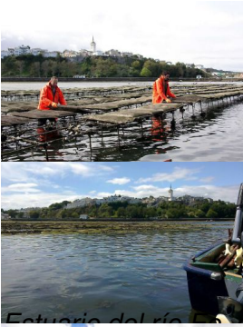
división natural entre Asturias y Galicia