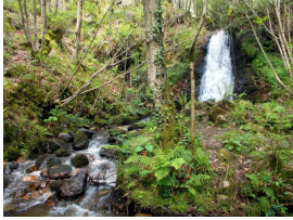
Cascada del río Nonaya, Salas

Publicado por Cicloturismo - 22 May 2016 11:23