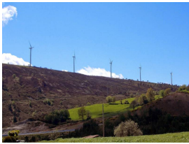
Parque eólico de La Sierra de Bodenaya, Salas

. En este punto podremos ver el Parque eólico de la Sierra de Bodenaya. Si el tiempo es bueno, incluso podremos divisar el parque eólico de las Peñas del Viento, en el concejo de Cudillero.