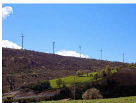
Parque eólico de La Sierra de Bodenaya, Salas

. En este punto podremos ver el Parque eólico de la Sierra de Bodenaya. Si el tiempo es bueno, incluso podremos divisar el parque eólico de las Peñas del Viento, en el concejo de Cudillero.