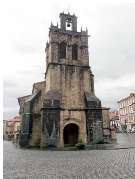
Colegiata de Santa María La Mayor, Salas

Tras 3 kilómetros de pista por el primitivo Camino de Santiago llegaremos a la Cascada del Nonaya . Este es un tramo técnico y probablemente con barro, y que seguramente muchos lo tengamos que