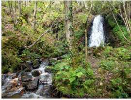
Cascada del río Nonaya, Salas

Publicado por Cicloturismo - 22 May 2016 11:23