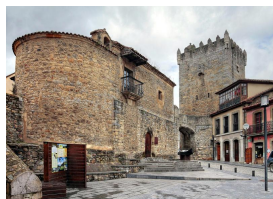
Castillo y Torre de Valdés Salas