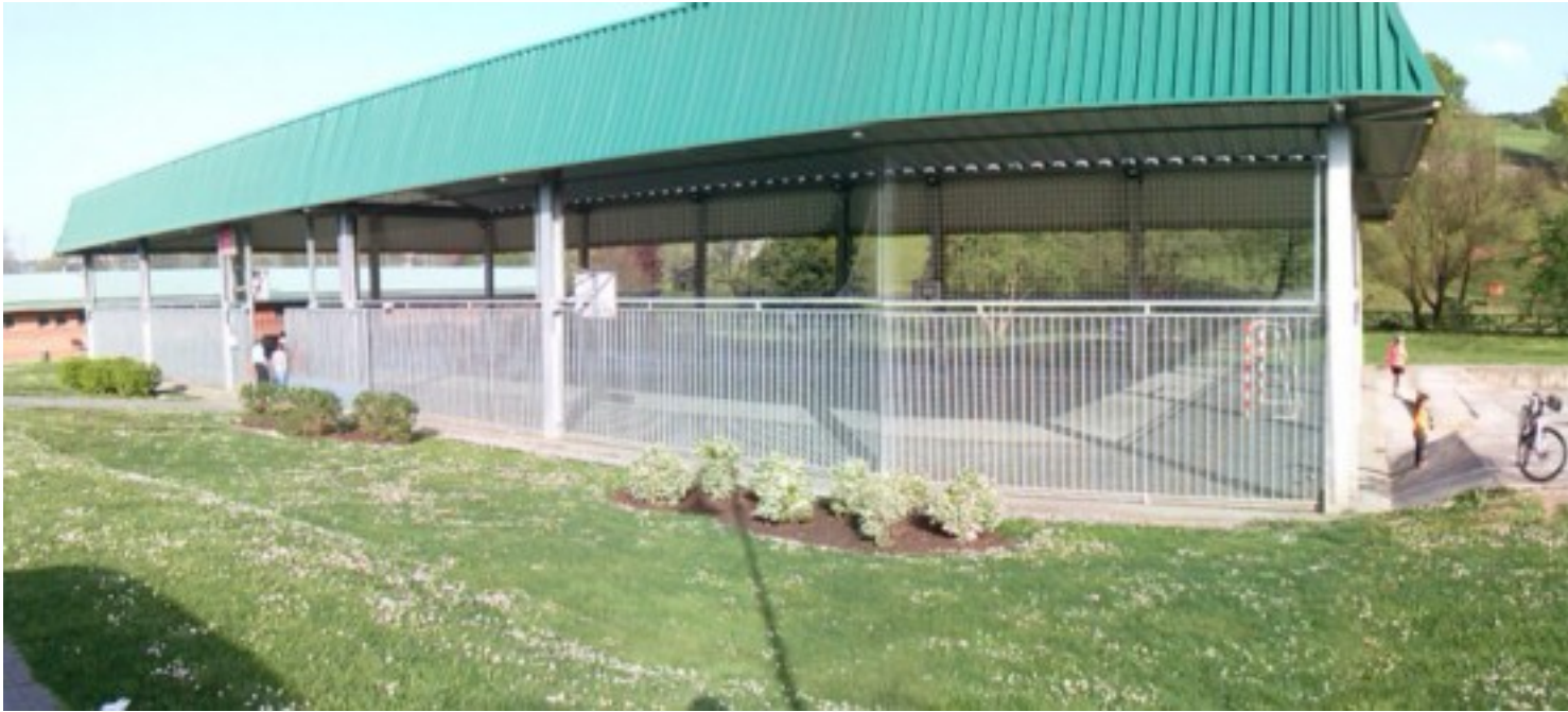
Polideportivo de La Camocha

Así que déjense cautivar por las aguas del arroyo Piles y Llantones y de la fuelle La Pinganilla , o de parajes sin igual como el de la Aliseda Pantanosa que les llevaremos a ver.