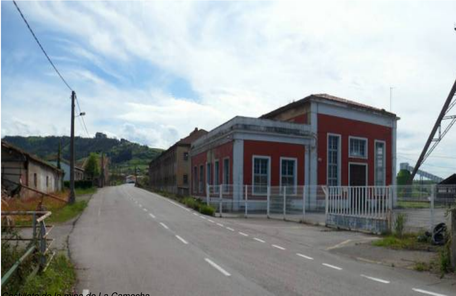
Castillete de la mina de La Camocha