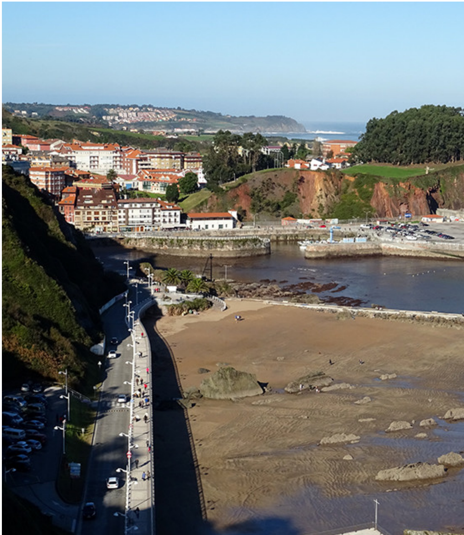
Puerto de Candás

Publicado por Cicloturismo - 15 May 2016 16:31