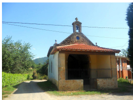
Ermita de San José de Romillín

, donde visitaremos su palacio, ya que la capital canguense es ampliamente conocida.