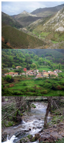
Valle del Zardón, Cangas de Onís