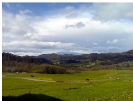
Las Regueras, dominios del viento