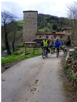
Palacio-Torre de Villanueva de Grado

Publicado por Cicloturismo - 09 Abr 2016 11:00