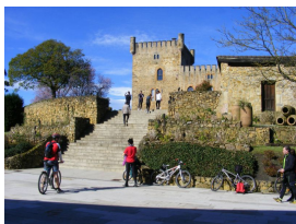
En la Torre Valdés (San Cucao de Llanera)