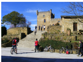
En la Torre Valdés (San Cucao de Llanera)