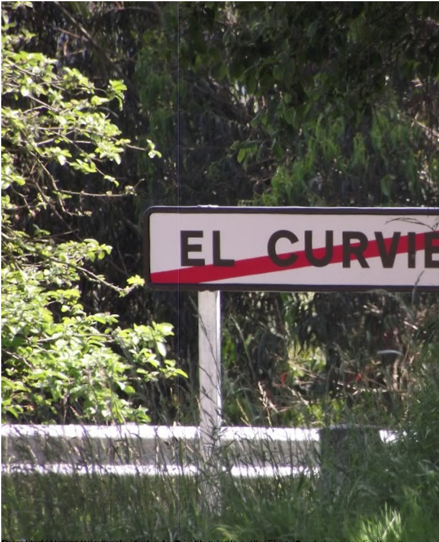
De la sesión de trabajo de la tarde del día de las Provincias de la ruta El rey San Lorenzo y por el carril Transporte.