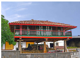
Panera en Cenero

¡Quien venga, tendrá que besar al gochín en el morrín!