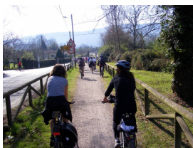
legando a Deva por la senda de Peñafrancia