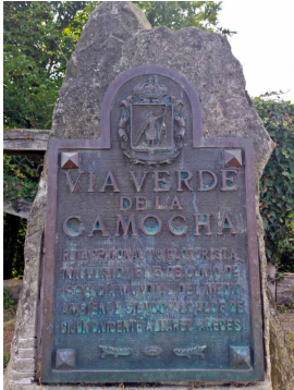
Placa V.V. La Camocha