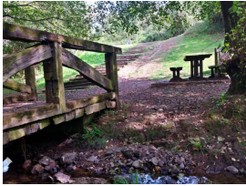
La recreativa de La Pinganiella