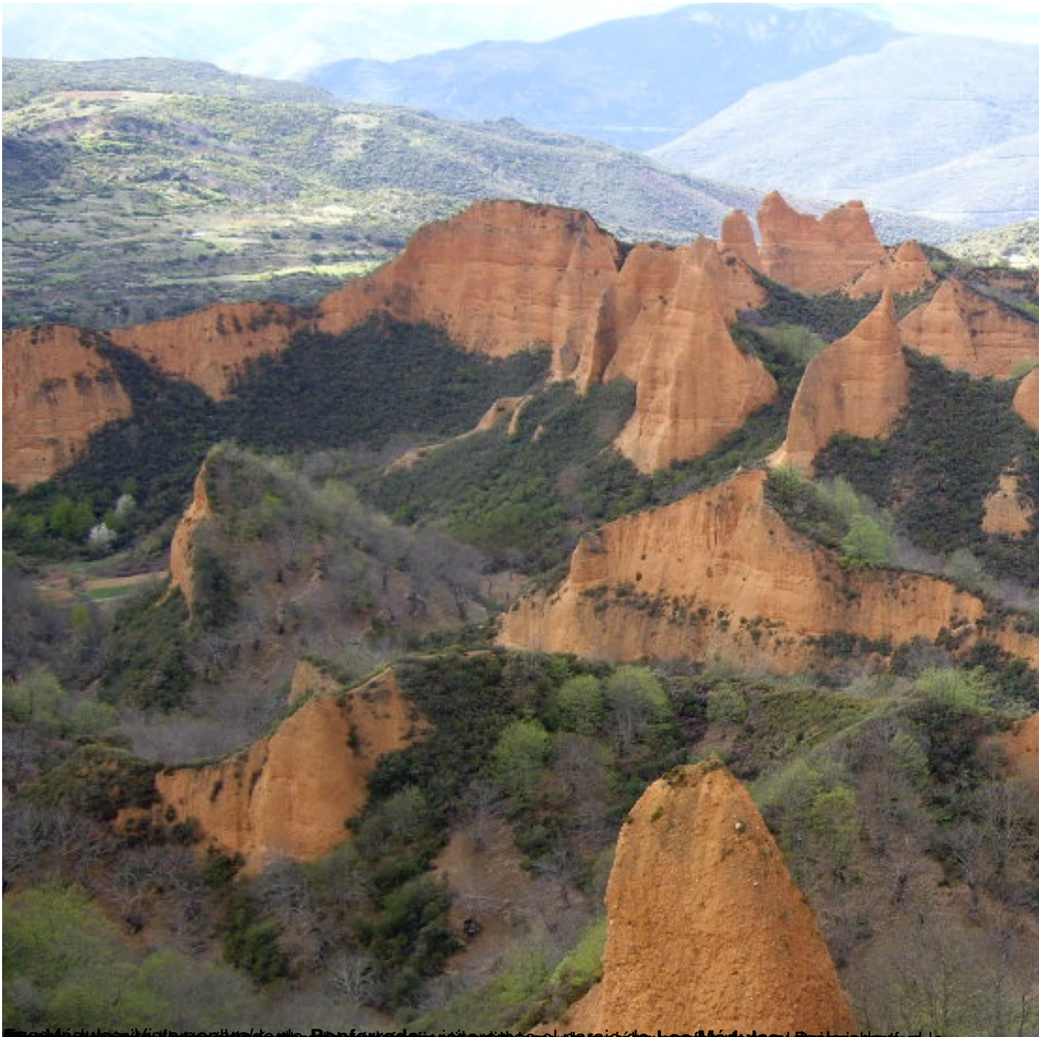
Formación de las montañas de los Mochales, Asturias, España. La imagen muestra la