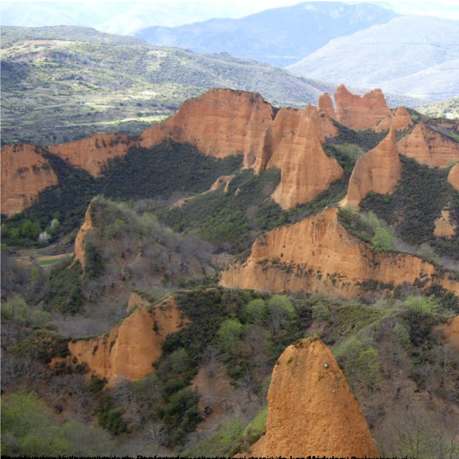
Parque Natural de los Médanos. Páramo de los Médanos, Asturias. España.