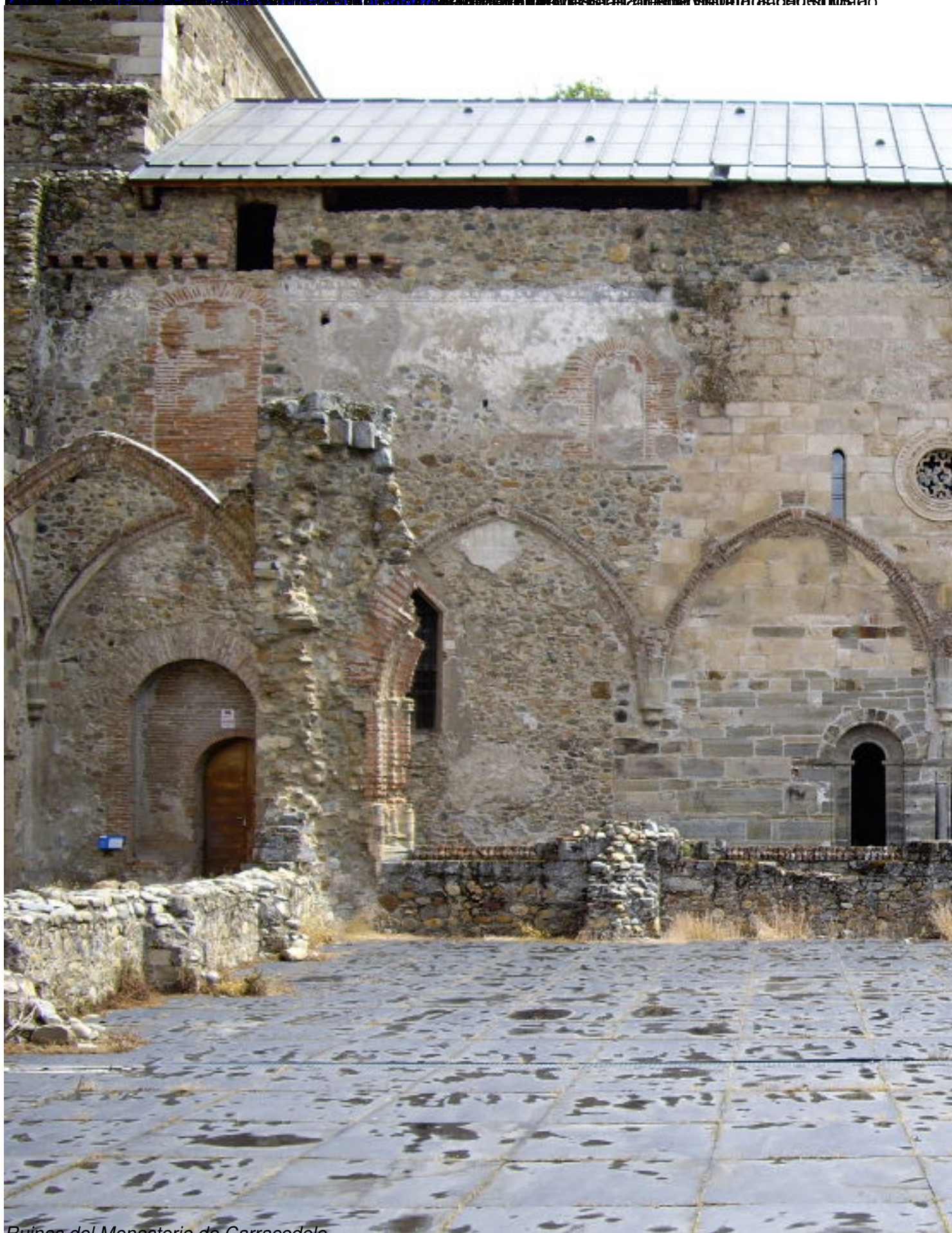
Ruinas del Monasterio de Carracedelo