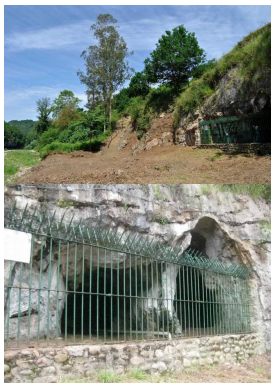
Cueva de La Lluera

Publicado por Cicloturismo - 06 Mar 2016 00:58